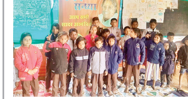
हरिभूमि न्यूज ॥ ललितपुर

अमृता हॉस्पिटल के प्रांगण में विगत 4 से अधिक वर्षों से चलने वाली अमृता पाठशाला में लिटरेरी क्लब ऑफ़ अमृता के ऊर्जावान विद्यार्थियों ने रविवार 2 नवम्बर को पाठशाला में आकर बच्चों को सुखद भविष्य हेतु मोटिवेट किया। उन्हें अच्छी तरह हाथ धोना, पैरों को साफ़ कारना, साफ़ कपड़े पहिनना व शुद्ध भोजन का महत्त्व बताया। फिनाइल डालकर पौधा लगाना बताया। सभी बच्चों को सुन्दर जारकिन दी ताकि सर्दियों में उन्हें परेशानी न हो।